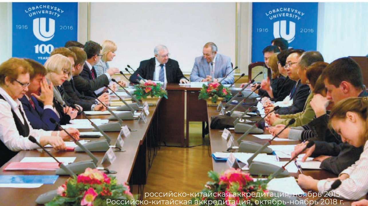
российско-китайская аккредитация, ноябрь 2015 Российско-китайская аккредитация, октябрь-ноябрь 2018 г.

По итогам международной аккредитации образовательные программы по специальностям и направлениям подготовки "Химия" и "Международные отношения" Национального исследовательского Нижегородского государственного университета им. Н.И. Лобачевского включены в DEQAR – Европейский реестр программ, признаваемых в европейском пространстве высшего образования.